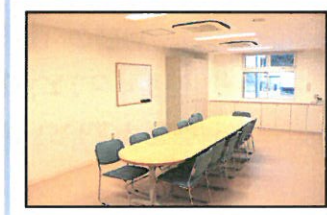
【ボランティアルーム】